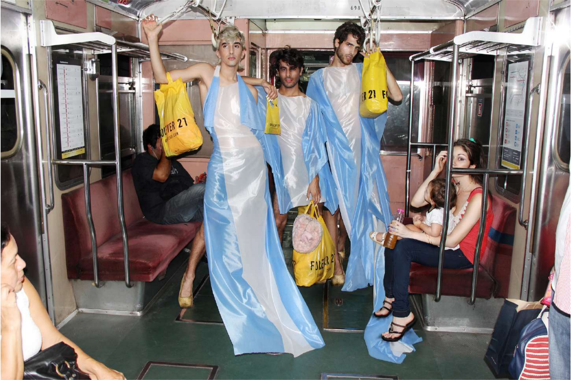
FOREVER / digital print / 50 x 70cm (19.6 x 27.5in) / 2015