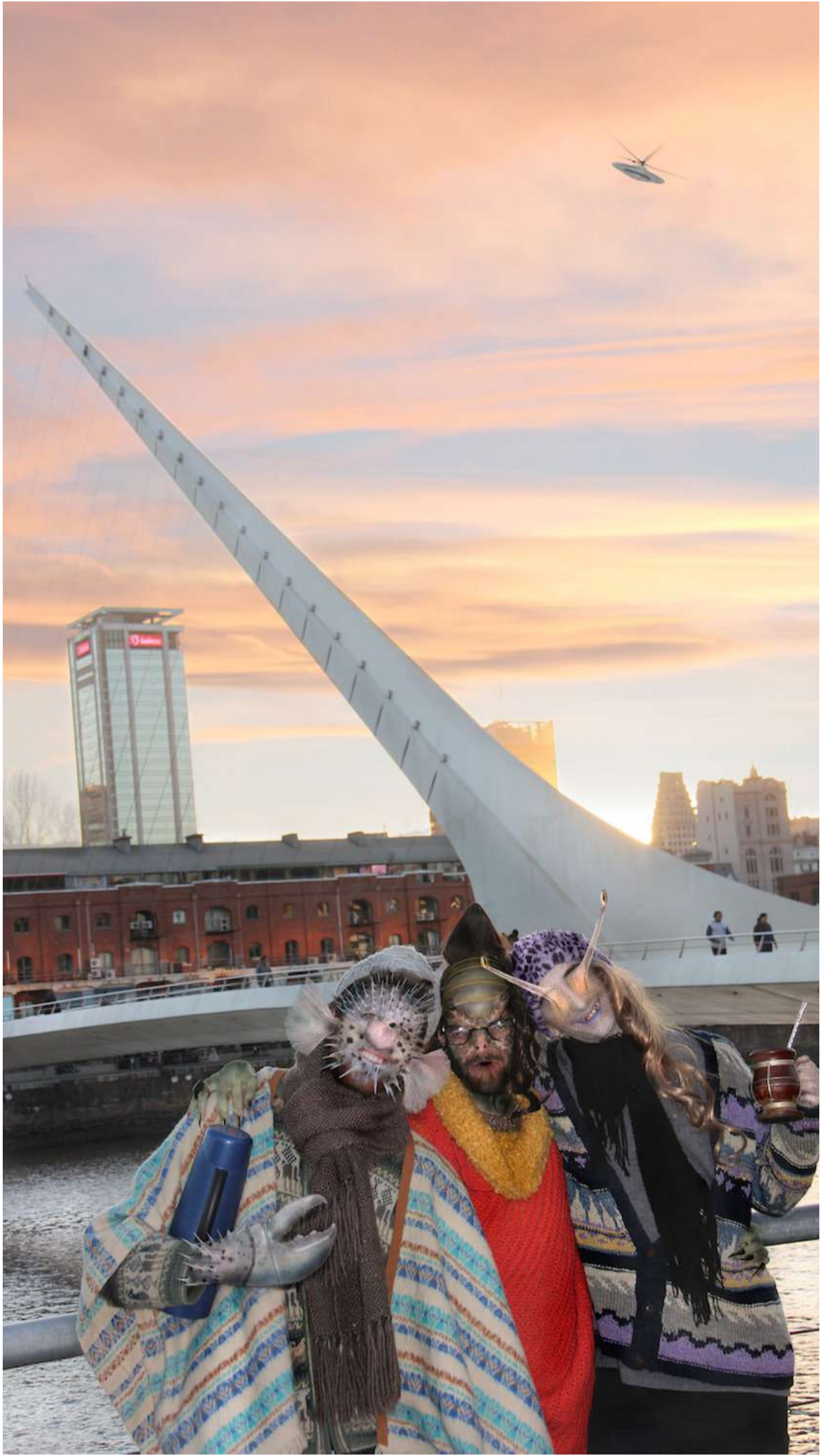
RAMBLERAS digital print 70 x 50cm (27.5 x 19.6in) 2015