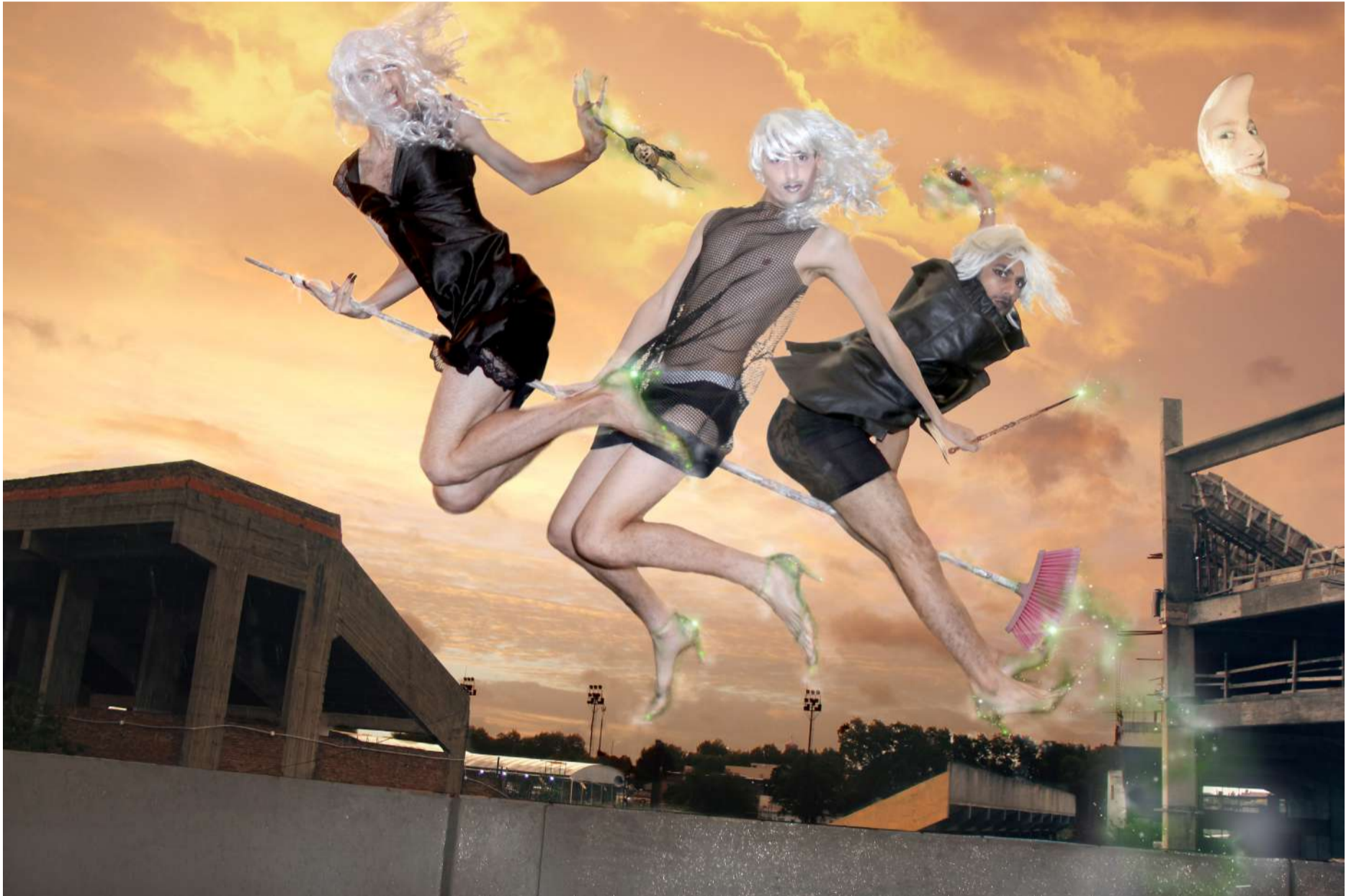
BRUJITAS / lightbox / 42 x 30cm (16.5 x 11.8in)/ 2016