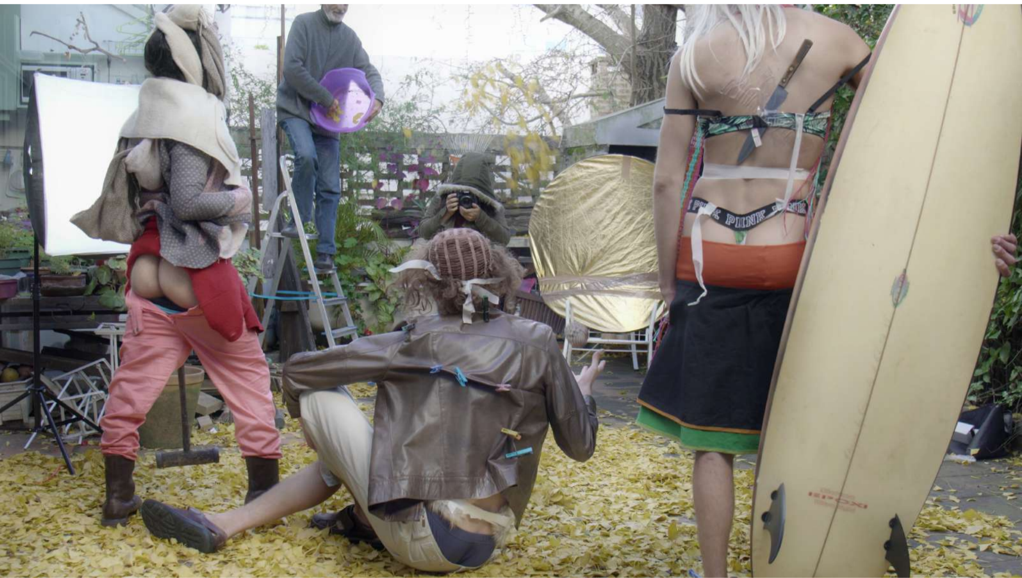
BAREBACK video 1 min 2018