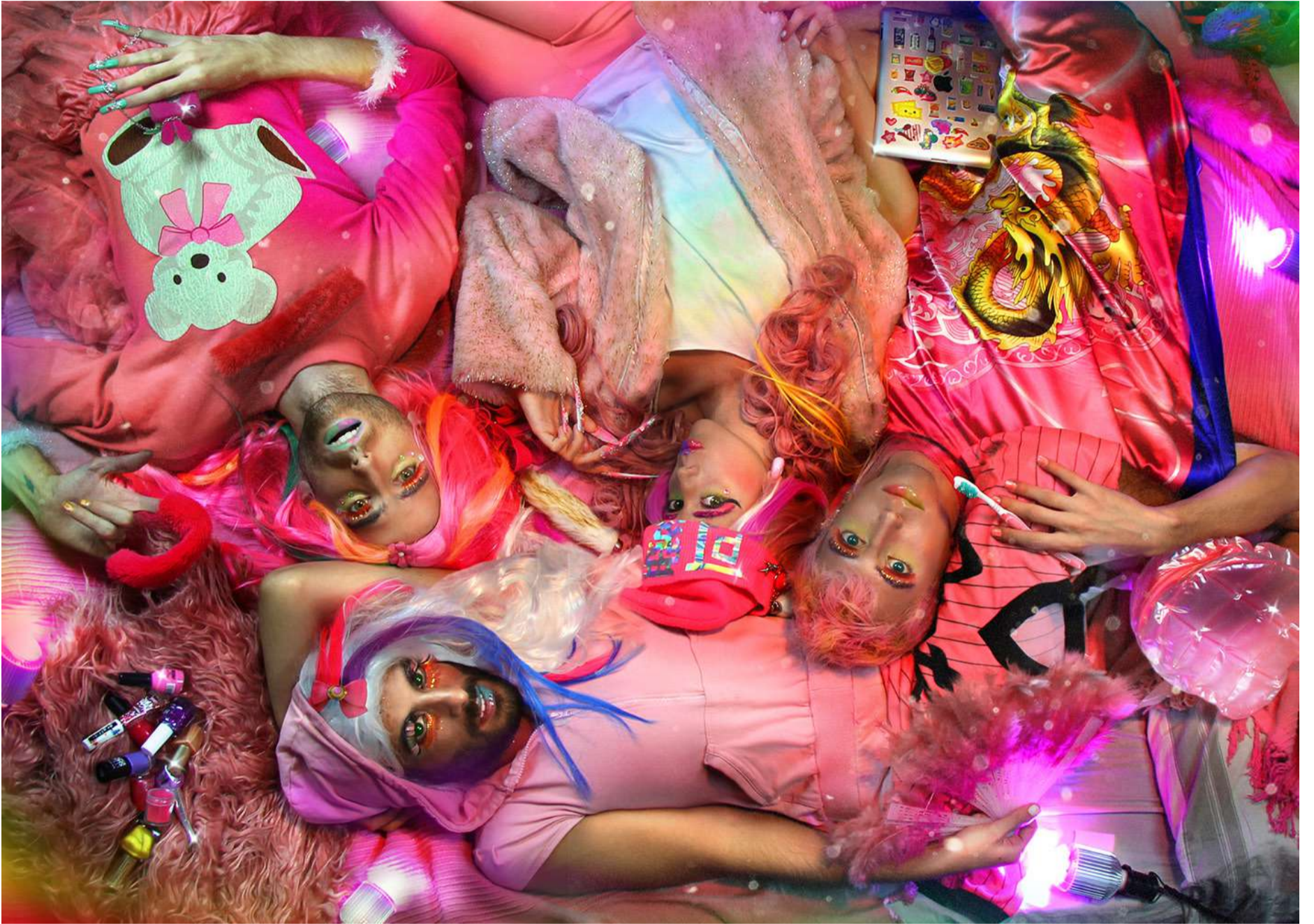
(N_N)-(O_O)-(@_@)-(^_^) / digital print / 50 x 70cm (19.6 x 27.5in) / 2015