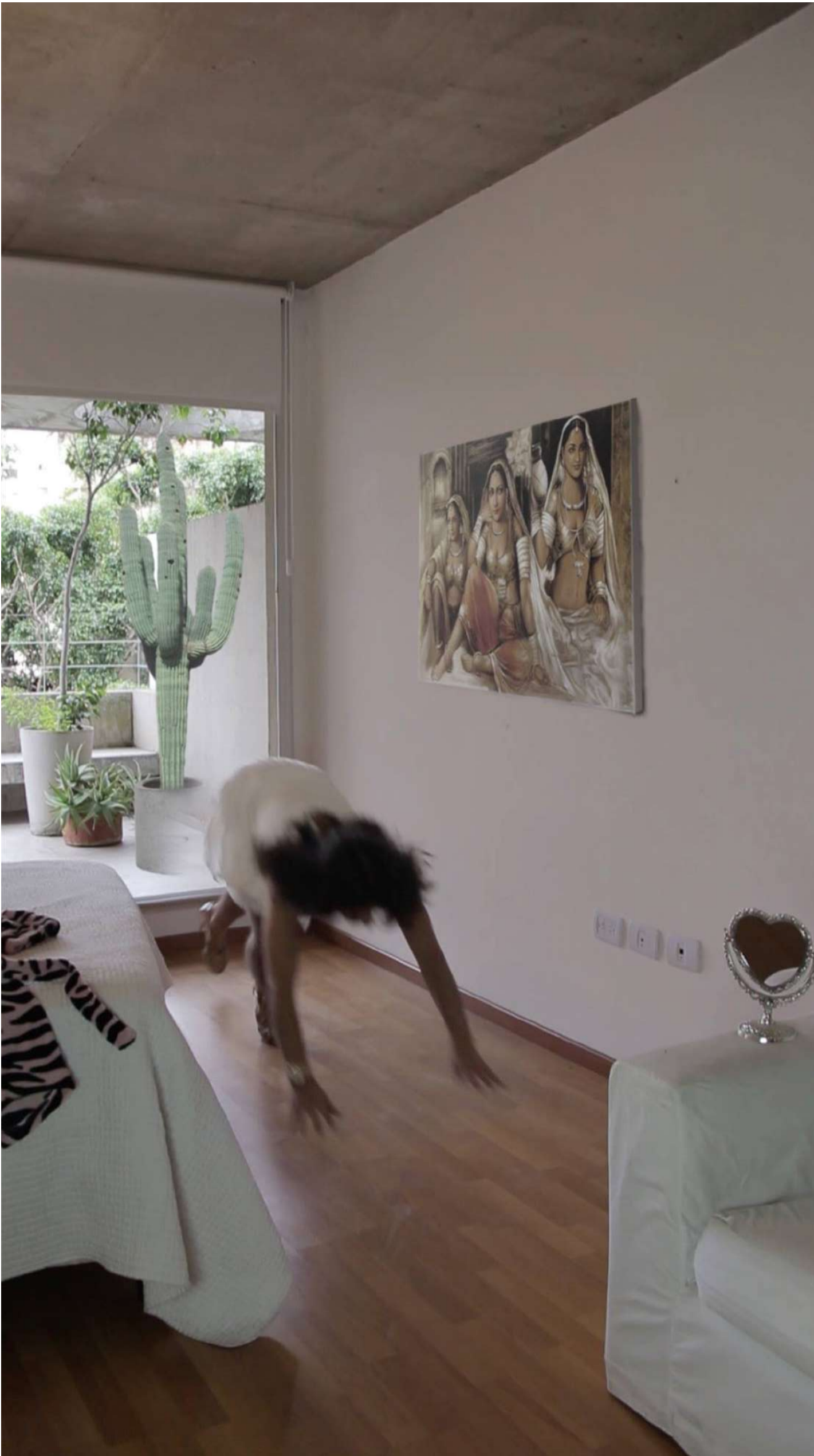
MORPHING Video 08:30min (loop) 2016