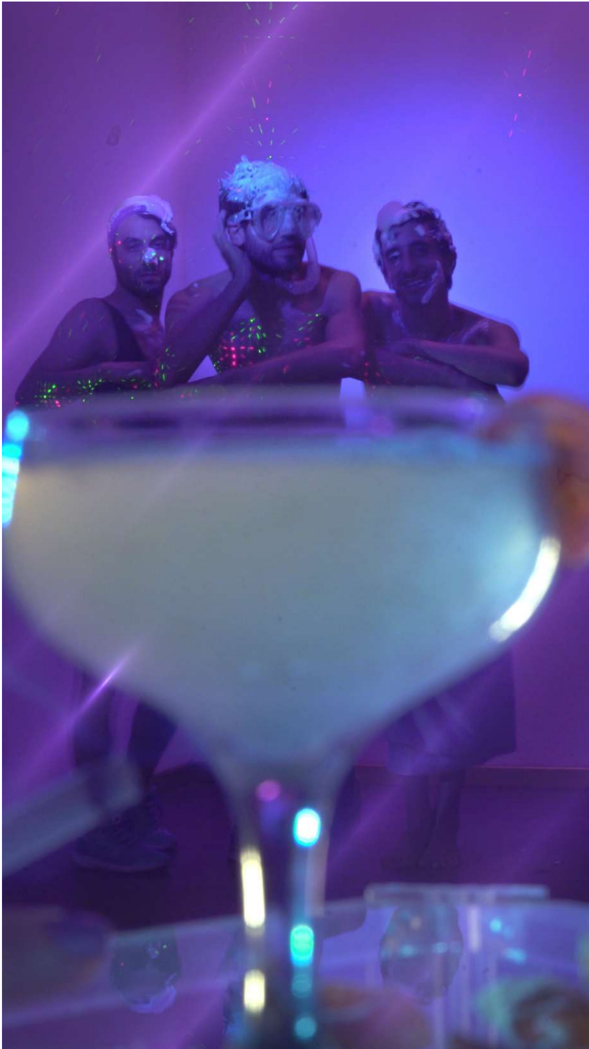
ESPEJISMOS Video 1min (loop) 2018