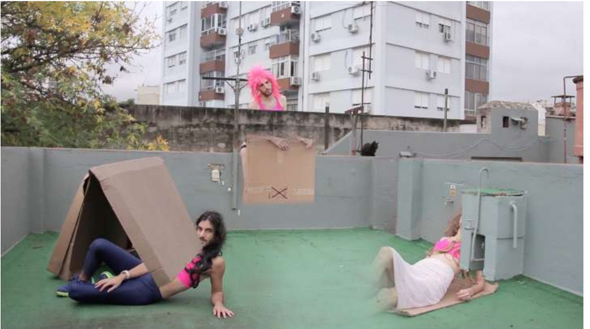
CONCEALING / Video / 5:09min / 2016