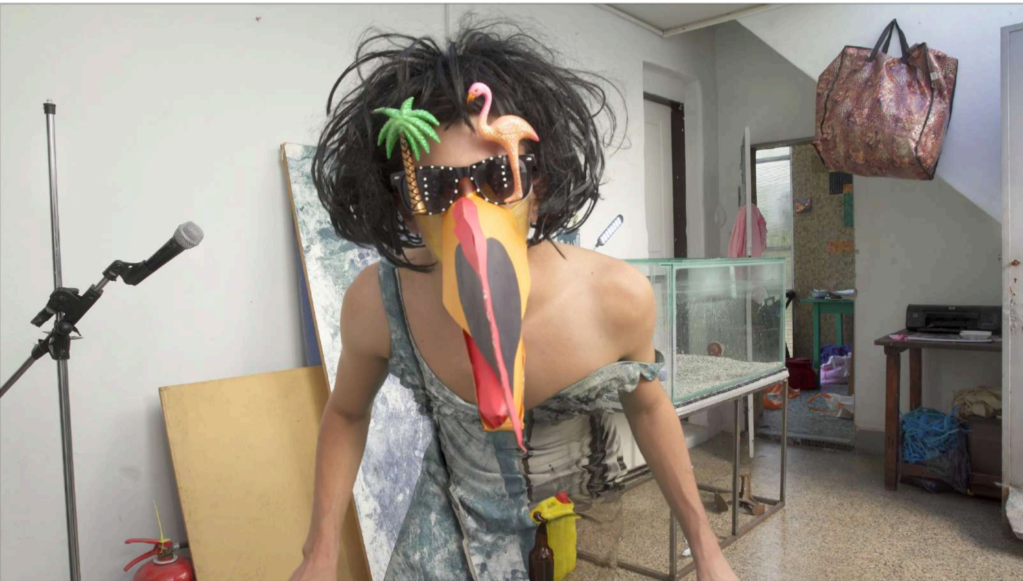
PAJARRACAS Video 1:10min (loop) 2018