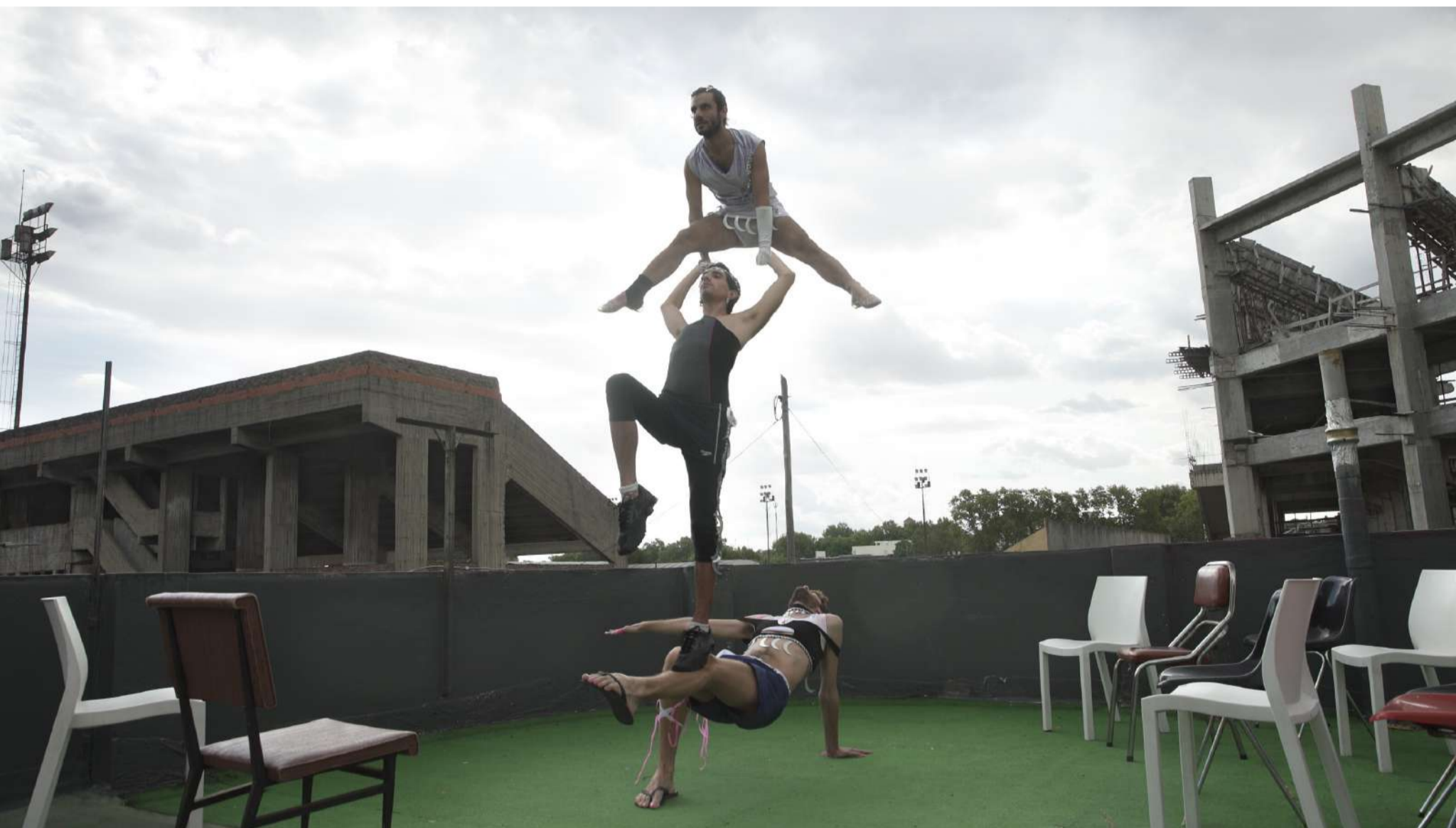
ACROBÁSICA Video 1:10min (loop) 2018