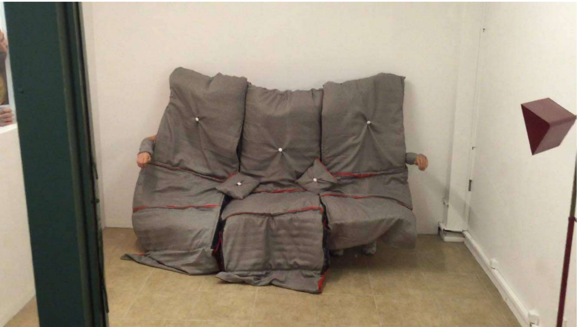
SILLÓN (REVEAL) / Performance / duration: 15 min