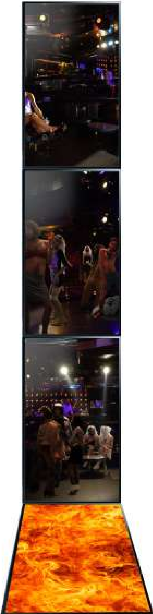
IL TEMPO Video instalación loop 2017