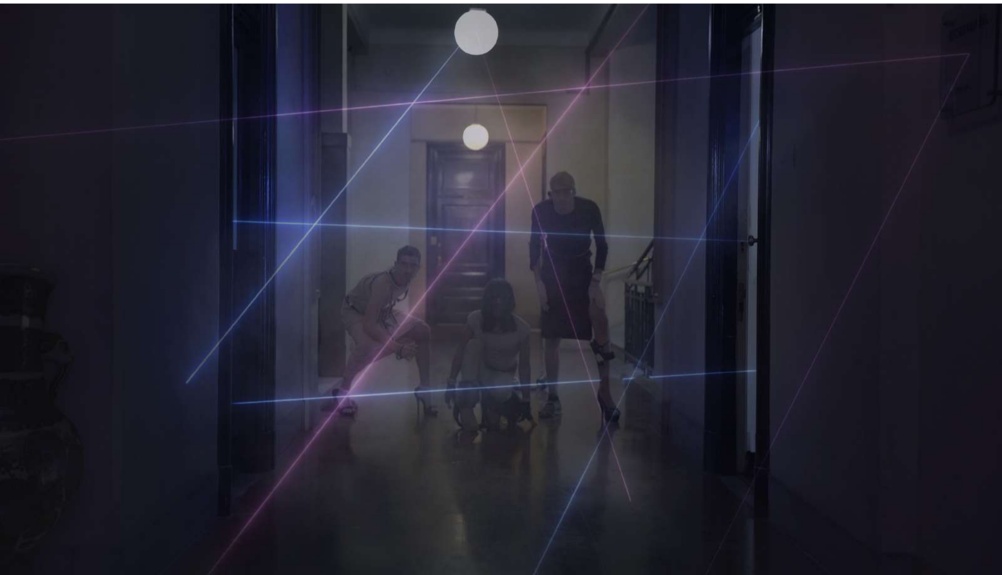
SPYDER Video 2min (loop) 2017